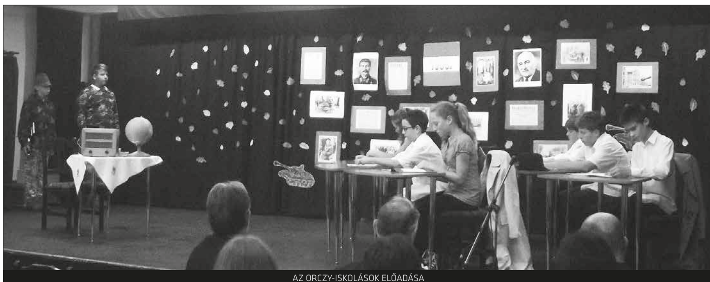
AZ ORCZY-ISKOLÁSOK ELŐADÁSA

Az előző évek gyakorlatához hasonlóan, Kiskundorozsmán az 1956-os forradalomra és szabadságharcra való megemlékezés ünnepi műsorral kezdődik és a kopjafa megkoszorúzásával ér véget.