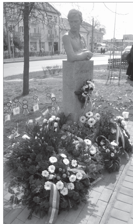
A megkoszorúzott szobor a Dísz téren.

Az én értelmezésem szerint a szabadság egyenlő a tisztelettel, mert az a gyermek, aki nem tiszteli családját, a lázadás rabságában szenved. Az a fiatal, aki nem tiszteli ősz hajú apját és anyját, az a hálátlanság rabságában szenved. Az az ember, aki nem tiszteli szomszédját, az azonos településen élőt, nem tud neki örülni, az az irigység rabságában szenved. És az a nemzet, amely nem tiszteli mások szabadságát, önmaga szabadságát is veszélyezteti. Mi, magyarok ezt pontosan tudjuk, történelmünk során kevés esetben törtünk mások szabadságára, de keservesen megfizettünk érte. Ha követtünk is el