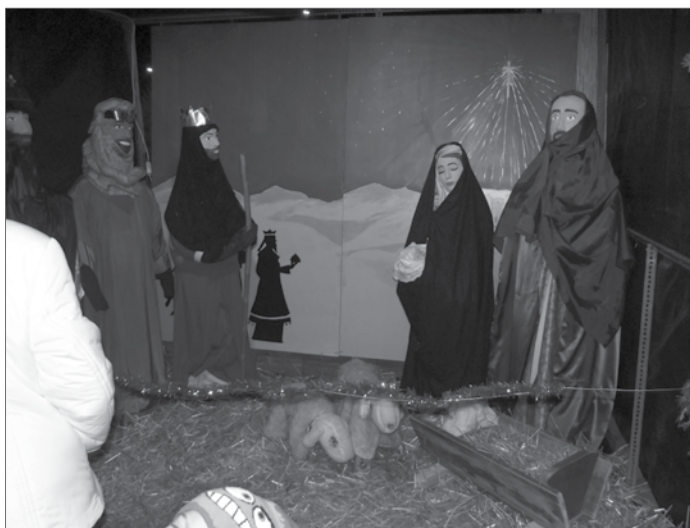
Jászolt állítottak fel a Dísztéren