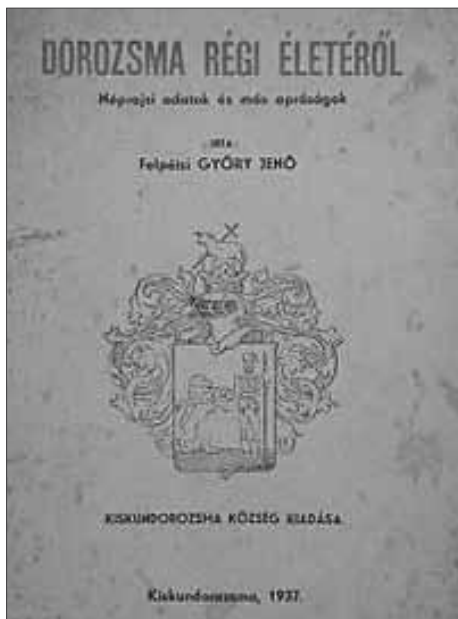
Felpéti György Jenő: Dorozsma régi életéről

1925-ben Kiskundorozsma közgyűlése azzal a feladattal bízta meg Sztriha Kálmán esperes plébánost, hogy a község újratelepítésének kétszázadik évfordulója alkalmából írja meg a község történetét. A könyv 1937-ben jelent meg, pontosan a II. világháború kitörése előtt. A közgyűlés pályázatára azonban érkezett még egy mű Felpéti György Jenő tollából. Dorozsma régi életéről címmel még ugyanabban az évben, kiegészítő kötetként jelent meg.