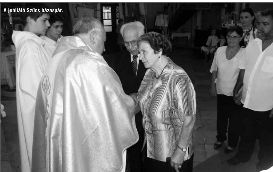
A jubiláló Szűcs házaspár.