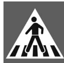
Csak a fekete vonalra szabad lépni!