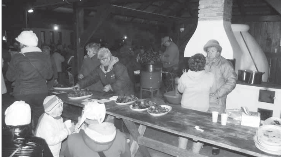
Mindenki Karácsonya Dorozsmán: sült gesztenye, sülttök, forralt bor és mi szem-szájnak ingere.