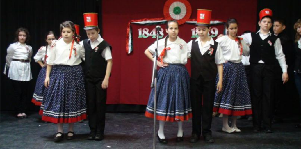
AZ ORCZY-S NÖVENDEKEK ÜNNEPI MŰSORÁBÓL

KÁBELTÉVÉ + INTERNET + TELEFON 5000 FORINTÉRT!