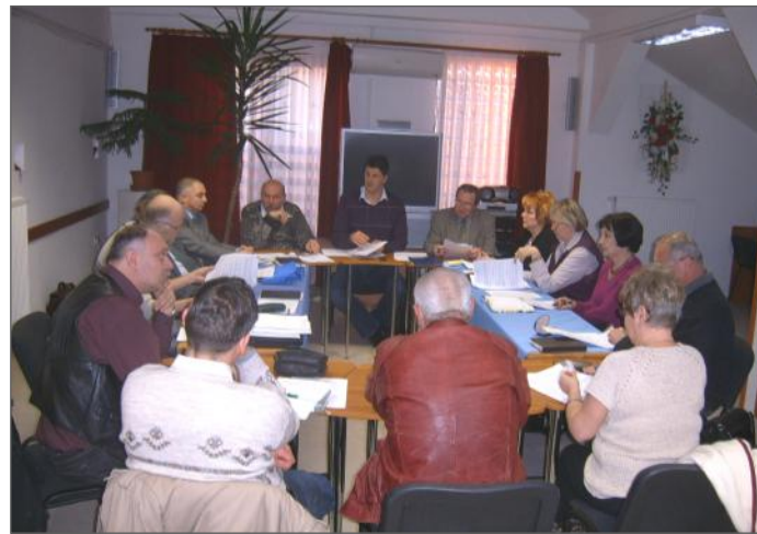
AZ ALAKULÓ ÜLÉS.