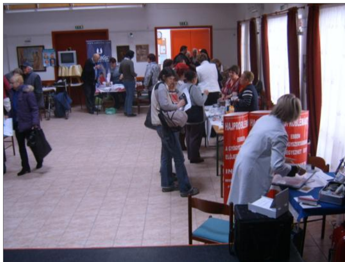
STANDOK ÉS ÉRDEKLŐDŐK.

– Ez a mi családunknál is így van. A mai napon megbeszéltük, hogyha azt szeretnék, hogy még sokáig főzzek, akkor kérjem ki a szak-