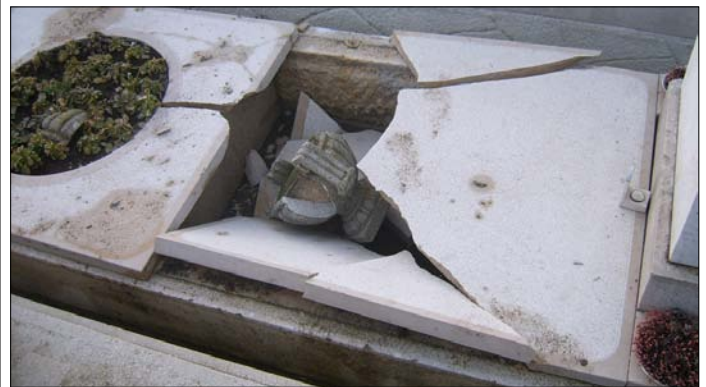
BÉKÉBEN NYUGSZANAK? EZ NEM CSUPÁN RONGÁLÁS, HANEM KEGYELTSÉRTÉS IS!