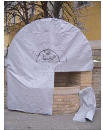
VALAKINEK ÚTBAN VOLT...

Szintén vandalizmus áldozatává esett több családi sír a dorozsmai temetőben. Az ugyancsak február közepén, a templomi reflektor megrongálásával feltehetőleg egyidőben elkövetett bűntény során nyolc sírt, valamint a temetkezési vállalat villanyórászekrényét rongálták meg. Megjegyeznénk, a temetőkapukat éjszakára