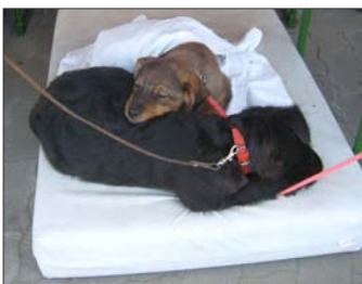
A NAP VÉGÉRE MÁR ELFÁRADTUNK, HIÁNYZIK AZ OTTHON MELEGE, EZÉRT EGYMÁST MELEGÍTETTÜK.