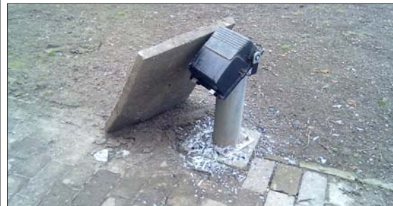
BETÖRT REFLEKTOR A TEMPLOMDOMBON.