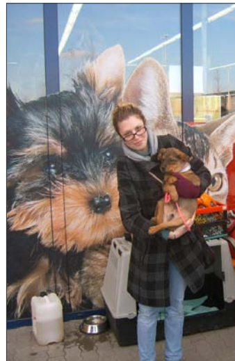
A NEVEM RUMLI, DE ÍGÉREM, ÚJ GAZDIMNÁL NEM CSINÁLOK RUMLIT.