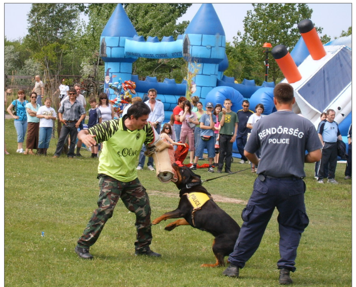
Rendőr-kutya akcióban - ajánlatos nem felbőszíteni...