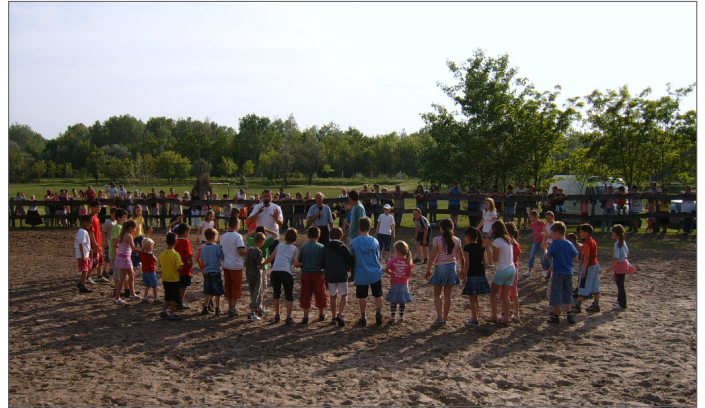
Tanyasi móka kicsiknek és nagyoknak