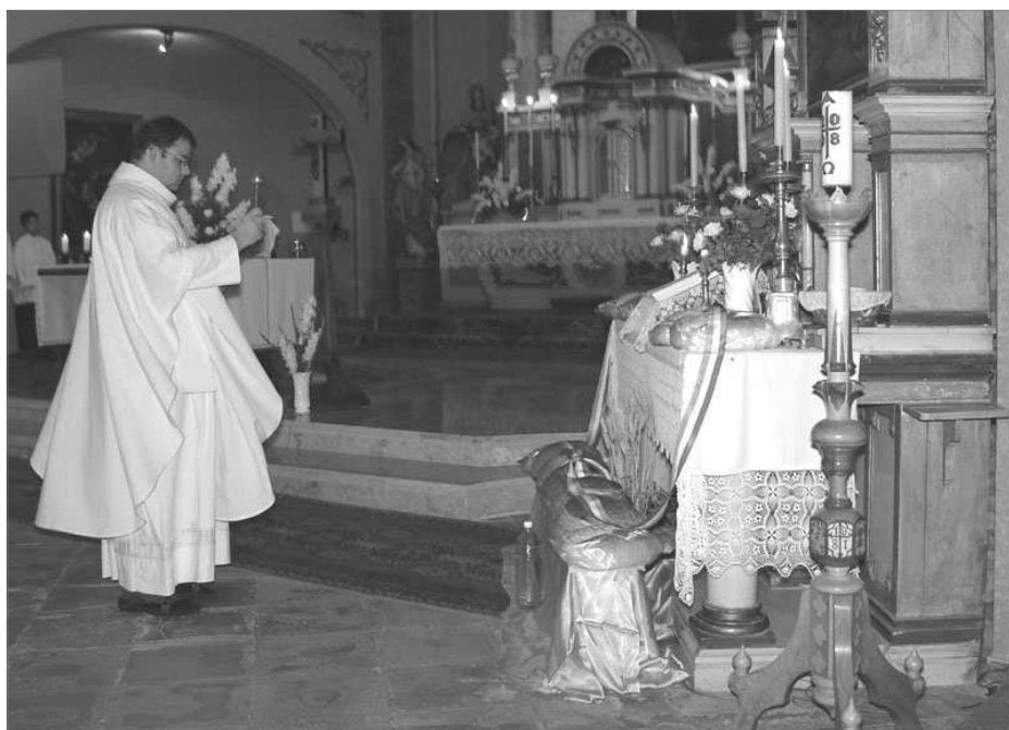
Az új kenyér megszentelése a templomban