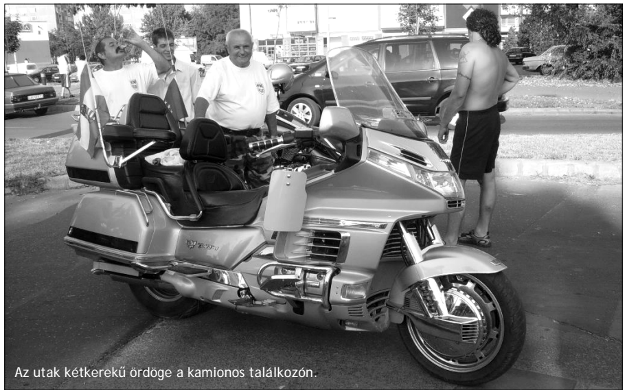
Az utak kétkerekű ördöge a kamionos találkozon.