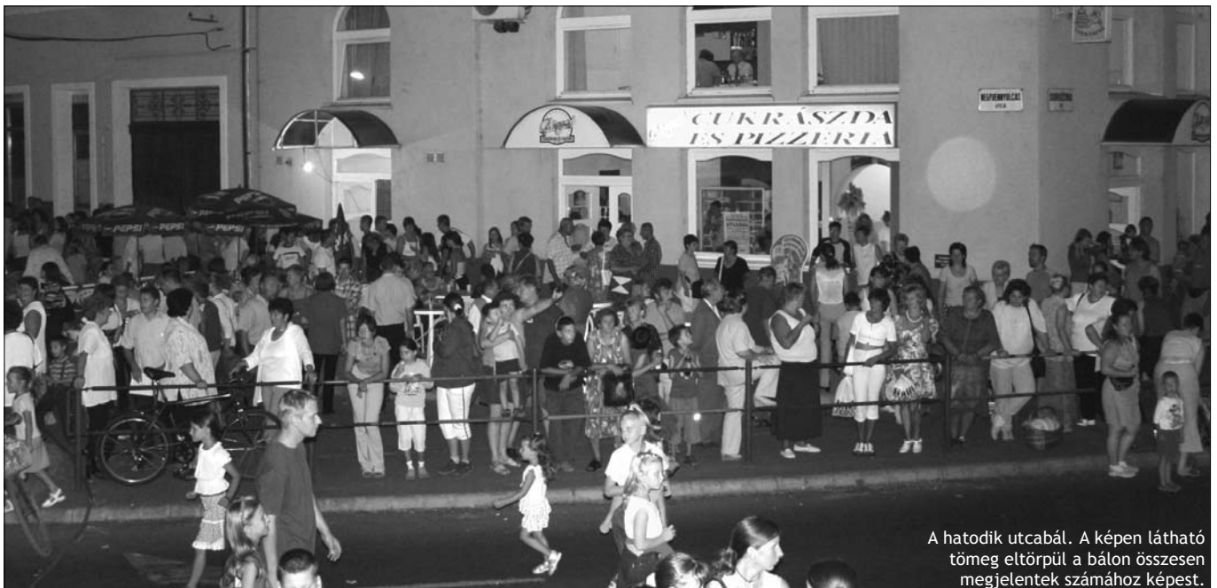
A hatodik utcabál. A képen látható tömeg eltörpül a bálon összesen megjelentek számához képest.