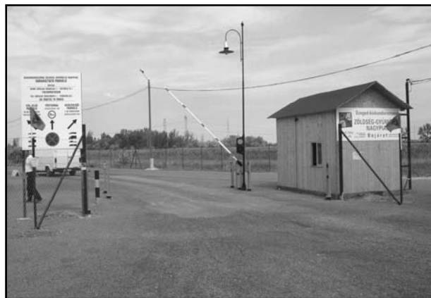
Az új beléptető-rendszer.