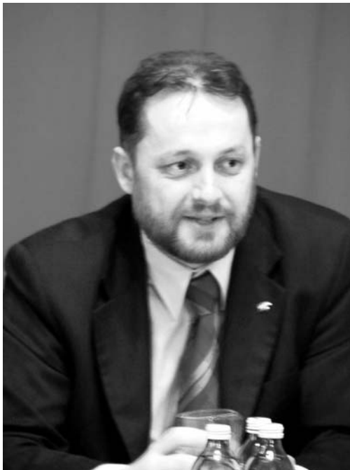
Nagy Sándor városfejlesztési alpolgármester