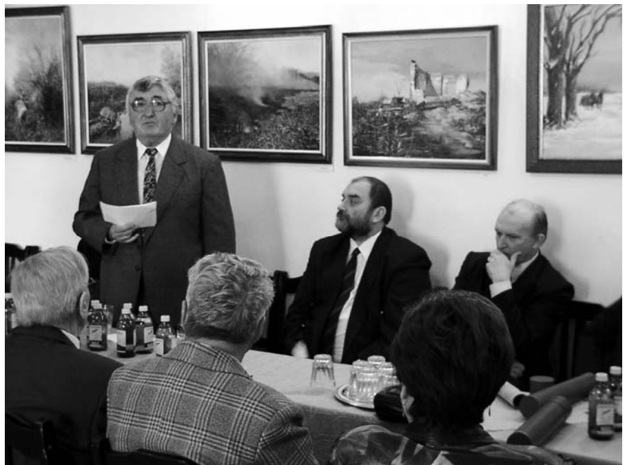
Tóth tanár úr beszámolóját tartja az emlékülésen.