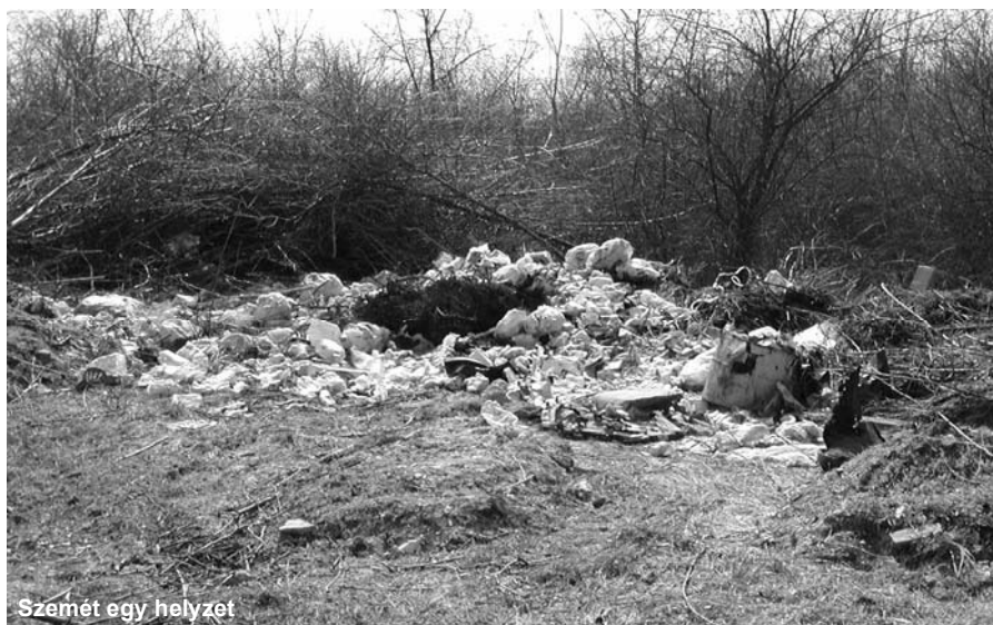
Szemét egy helyzet